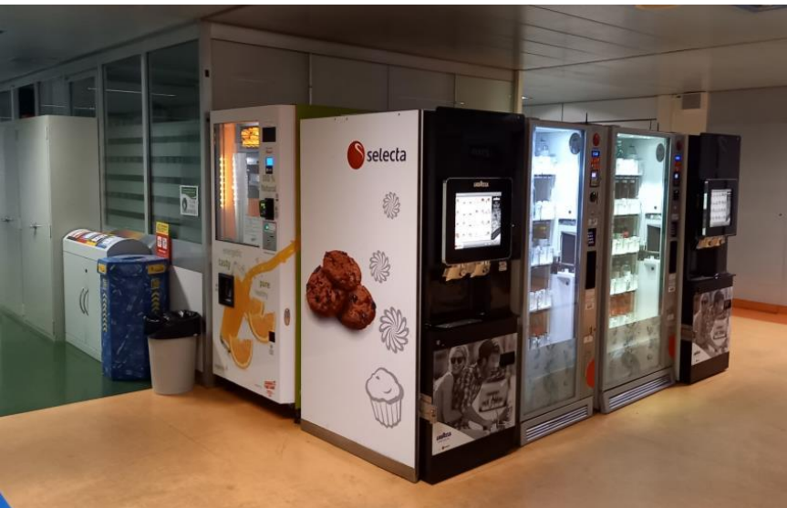
Afbeelding: Oude situatie

HUG, CHUV en Inselgruppe hadden dringend behoefte aan verbetering van het welzijn van het personeel na Covid. De hoogwaardige Lavazza koffieoplossing en de high-tech Foodies Grab & Go oplossing zorgden voor een technologie gedreven, cashloze, onbemande service van kwalitatieve, hoogwaardige gezonde én lokale snacks en dranken, 24/7 beschikbaar voor iedereen, op elk gewenst moment. Dit resulteerde in een grote toename van de bezettingsgraad, meer inkomsten - en geluk voor werknemers, patiënten en bezoekers.