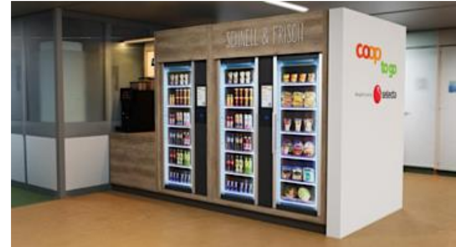
Afbeelding: Nieuwe situatie

Het aangeboden assortiment ging van "alleen snacks" naar verse voeding voor alle dagdelen, om het welzijn van de mensen te vergroten en een gezonde levensstijl te ondersteunen.