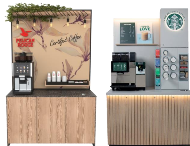
Afbeelding: Van links naar rechts; Pelican Rouge Sustainable Premium Coffee Corner, Starbucks™ coffee corner